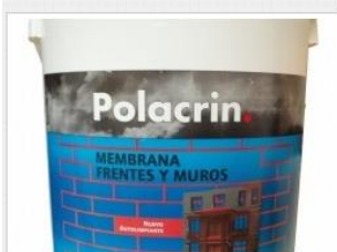
Polacrin impermeabilizante frentes y muros