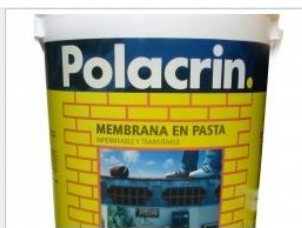
Membrana en Pasta