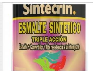
Esmalte Sintético - Triple Acción