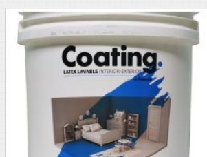
Latex Coating Interior - Exterior Lavable